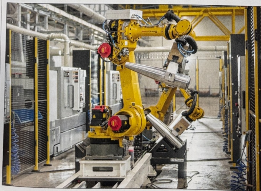
■ Aj vďaka rozsiahlym investíciám do automatizácie a robotizácie patrí spoločnosť MSM GROUP, s.r.o., medzi európskych lídrov vo vývoji a výrobe delostreleckej a tankovej munície