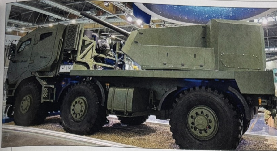
■ Na veľtrhu IDEB 2024 v Bratislave mala premiéru jedna z novinek slovenského obranného priemyslu – nový samohybný minomet AM120 z produkcie ZTS Špeciál z Dubnice nad Váhom

Európskej únie a partnerských krajín Severoatlantickej aliancie. Práve naše zapojenie do prípravy legislatívnych zmien považujem za kľúčové, ak máme mať vplyv na vytváranie adekvátnych podmienok pre jednotlivé spoločnosti pôsobiace v našom združení.